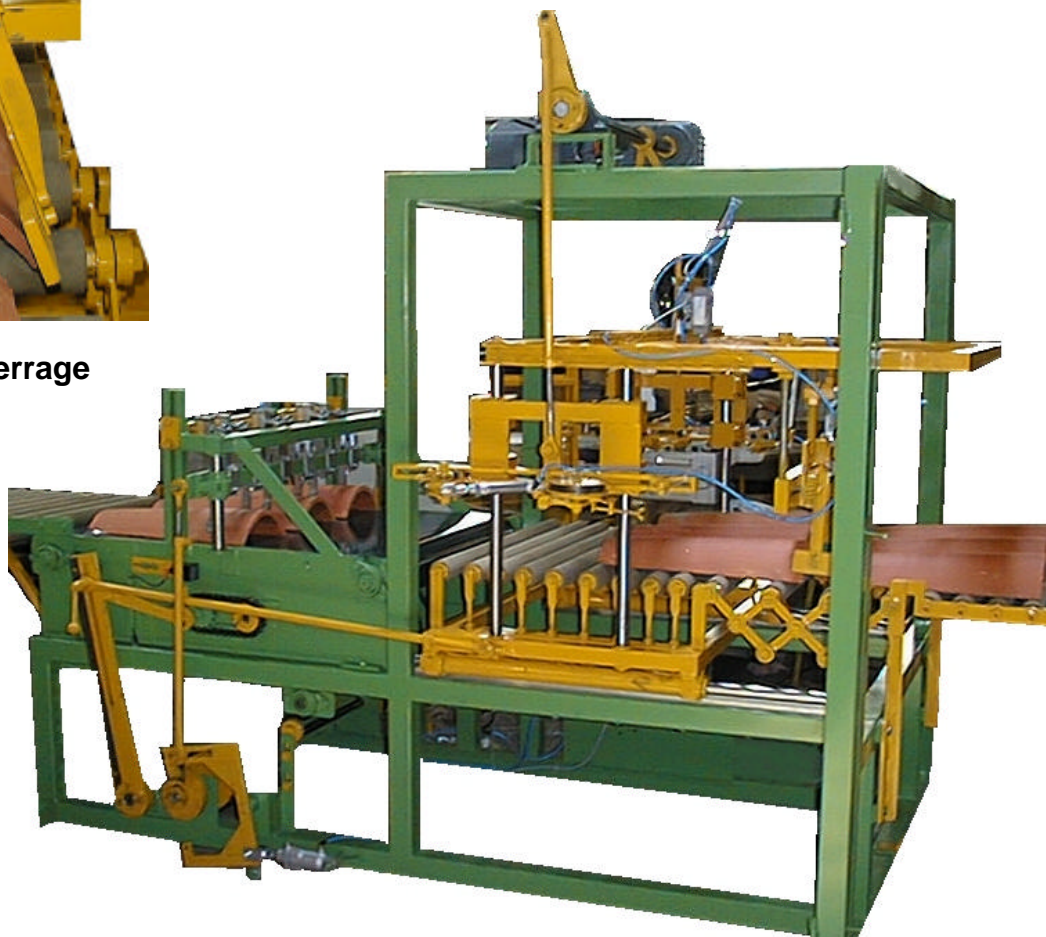
Coupeur 800 FH tuiles – Vue générale